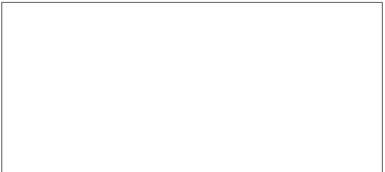
Схема монтажа ИБУ